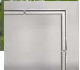
verschweißte Ecken bei Kreuzecken und am Bodenrahmen