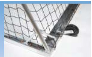
Eckausführung mit Bodenrohr