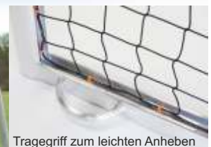
Tragegriff zum leichten Anheben